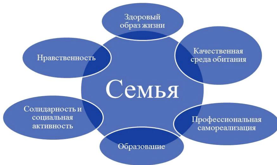
Рис. 3. Модель социализации

В качестве стратегической базы реализации государственной молодежной политики в Нижегородской области предлагается модель социализации, включающая в себя семь приоритетных направлений (см. рис.3).